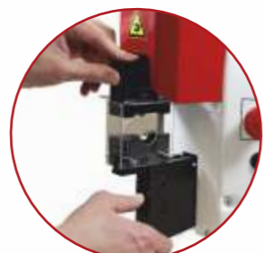
Einfaches Austauschen der Adapter Easy exchange of the adapters Echange facile des adaptateurs